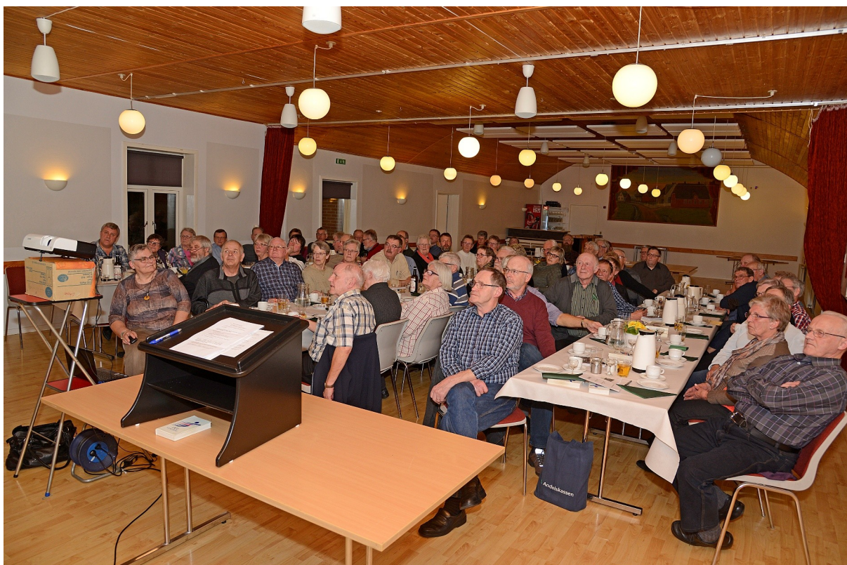
Fra generalforsamlingen den 6. marts 2013 i Farup Forsamlingshus.

arbejdet på tværs i kommunen og ikke mindst sikrer arkiverne adgang til Arkibas gennem et kommuneabonnement. Løsningerne i kommunerne er ikke ens og midlerne slet ikke, men bortset fra Vejen Kommune, hvor samarbejdet mellem arkiverne måske ikke har fundet sit endelige leje endnu, har det alt andet lige bragt arkiverne i en dialog, som ikke var til stede før, men som i dag er til nytte og inspiration i det daglige arkivarbejde og forhåbentlig også til glæde for brugerne. Arkiverne lærer nemlig af hinanden.