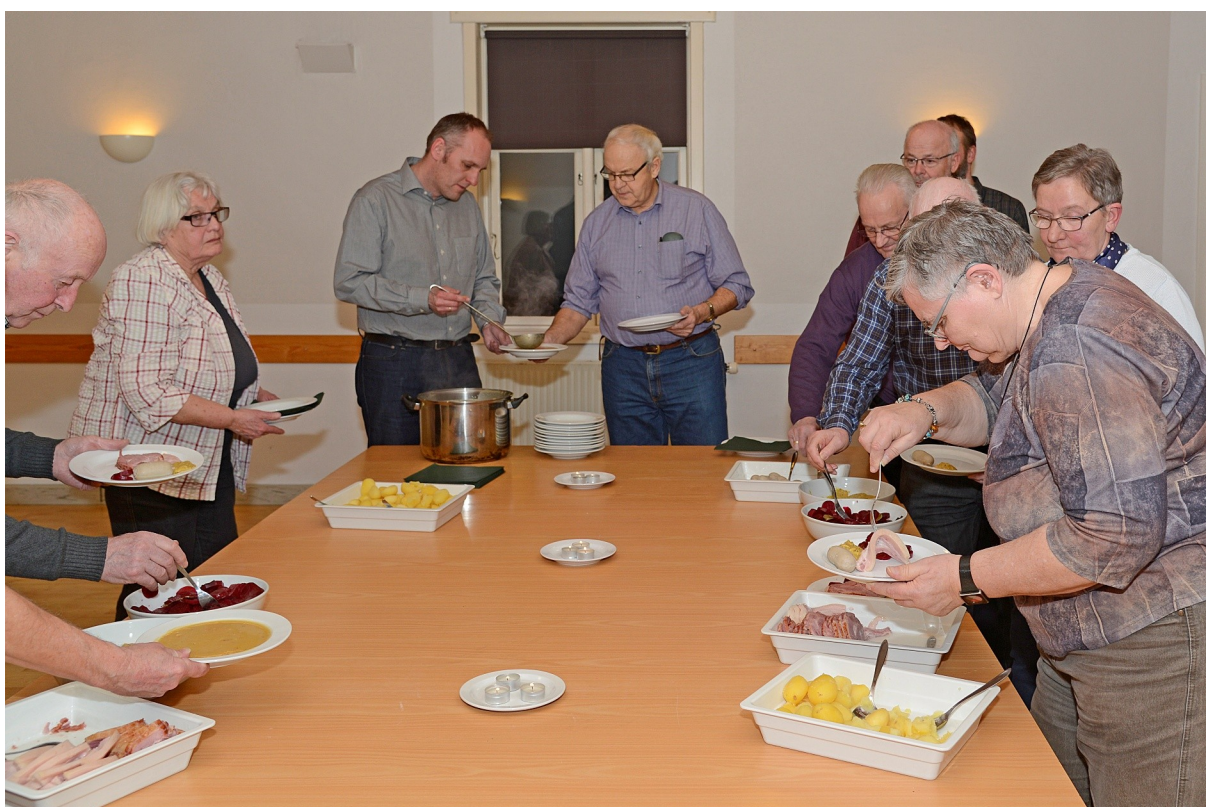
Efter generalforsamlingen var der traditionen tro gule ærter - her ses konsulentten udfolde hidtil ukendte talenter som "æ supman".

Tilbage til kursusvirksomheden som i 2012 bestod af fem Arkibas-kurser, et modulkursus samt et velbesøgt kursus om Formidling i arkiverne, der fandt sted i Hellehallen den 28. november. Med