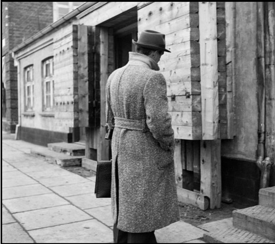
Mand ved ejendom. Men hvor ligger ejendommen? (78162 - PB 1079).