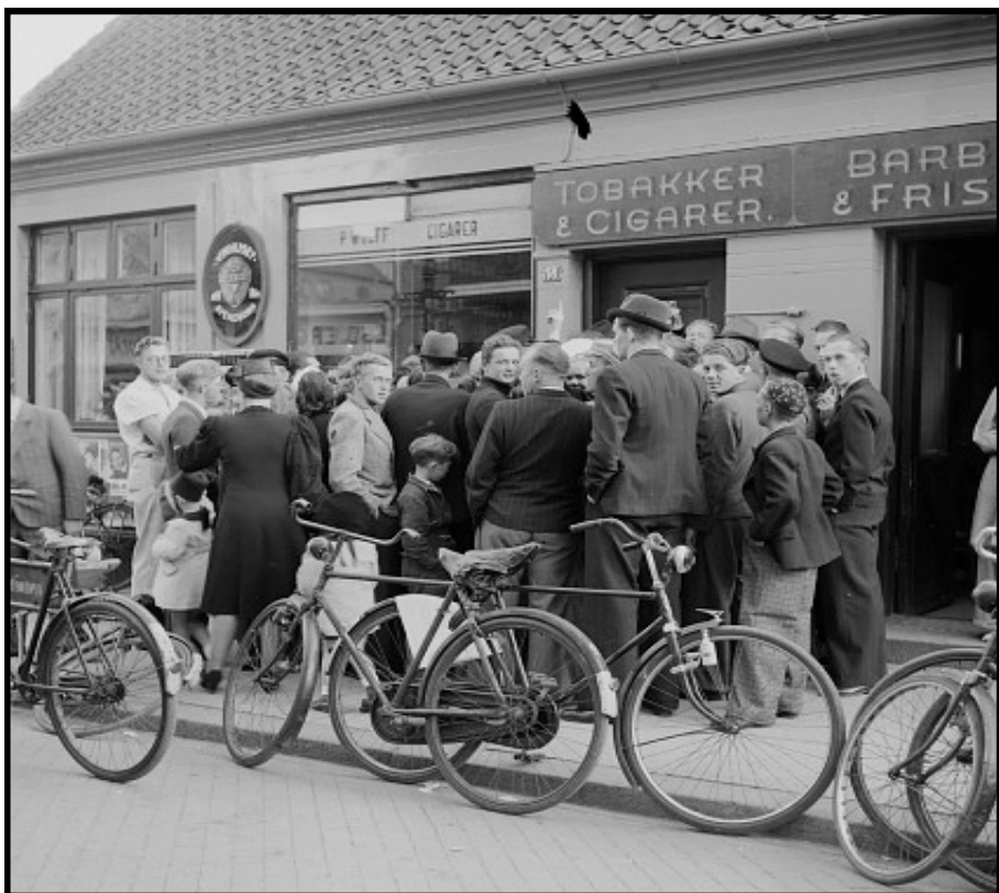
»Kesse og Kris«. Det stod på negativarket, men hvor ligger butikken? Billedet er formodentlig fra 1947. (78200-008 - PB 1899)