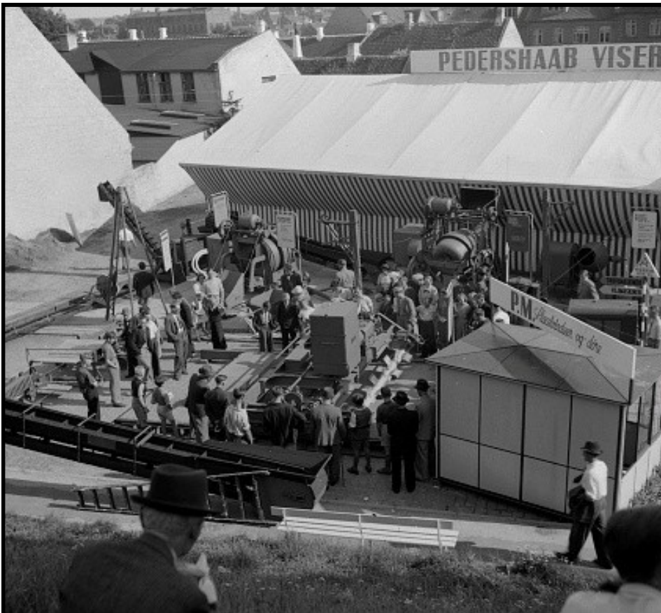
En udstilling fra Pedershåb Maskinfabrik, men hvor? (78186-008 - PB 1860)