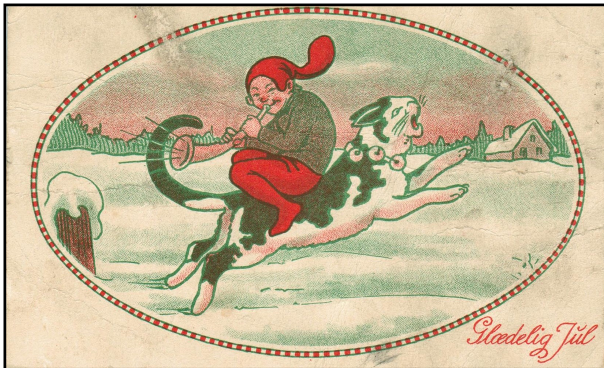
Postkort fra 1928.

Af Olga Pedersen, arkivleder, Aastrup Sognearkiv