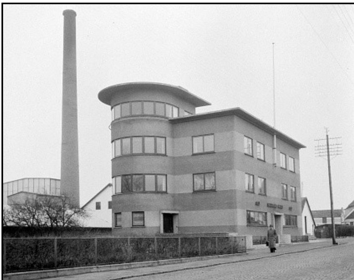
Facadefoto af ejendom. På negativarket står der: Privat. Kesse. Ukendt årstal. Hvor ligger huset? (78161 – PB 1079)

Som regel har vi held med os, men på billedaften 43 den 30. oktober løb vi ind i nogle billeder, som næppe er fra Esbjerg, og hvor forsamlingen måtte give fortabt. Derfor prøver vi gennem SVA-Nyt, om der blandt læserne er hjælp at finde. Mere konkret drejer det sig om følgende billeder, der alle er taget af fotograf Paul Bølling.