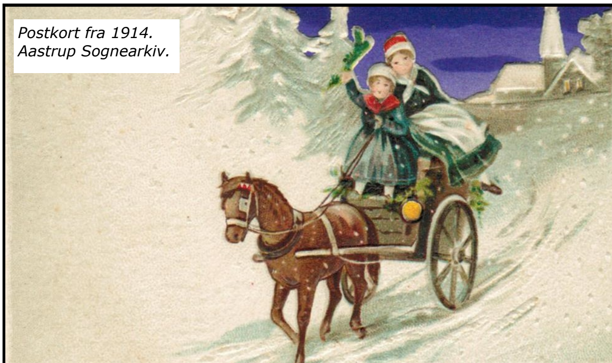
Postkort fra 1914.