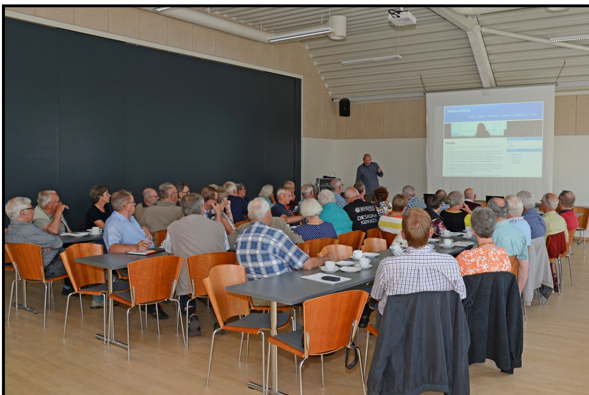
Fra Klargøringskurset i Helle-hallen den 24. juni 2014.

Det kan efterhånden ikke have forbigået nogen, at tiden med skråskrift og røde postbude er blevet afløst af edb og e-mail. Hvad enten man vil det eller ej, er det en udvikling man ikke kommer uden om! Også her i foreningen Sydvestjyske Arkiver (SVA) har de nye elektroniske publicerings- og kommunikationsformer vundet stort indpas, og er heldigvis noget, de fleste efterhånden er blevet rimeligt fortrolige med.