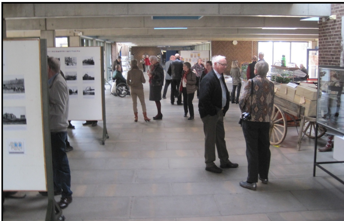
Billund-arkivernes fællesudstilling i Billund-centret havde i år jernbanen som gennemgående tema.

Af Richard Bøllund, arkivkonsulent, Sydvestjyske Arkiver