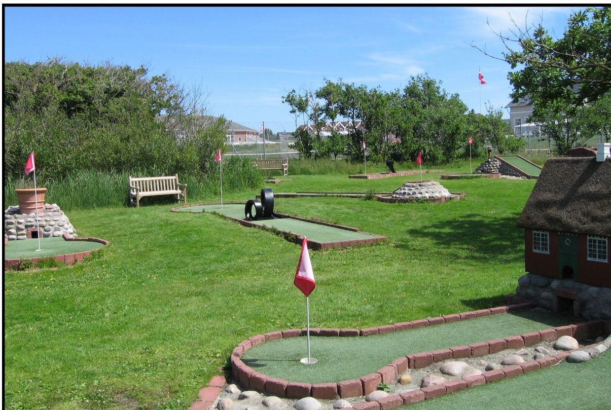
Billeder fra den nye - og nuværende minigolfbane ved Fanø Bad. Minigolf er en livlig og meget benyttet aktivitet i ferietiden.

værre har jeg ikke kunnet finde fotos derfra. Derudover er der baner ved Tempo Camping, Rødgårds Camping og Feldbergs Camping, der er måske også nogle i Sønderho? Minigolf er en god ferieaktivitet, som alle i familien kan hygge sig med.