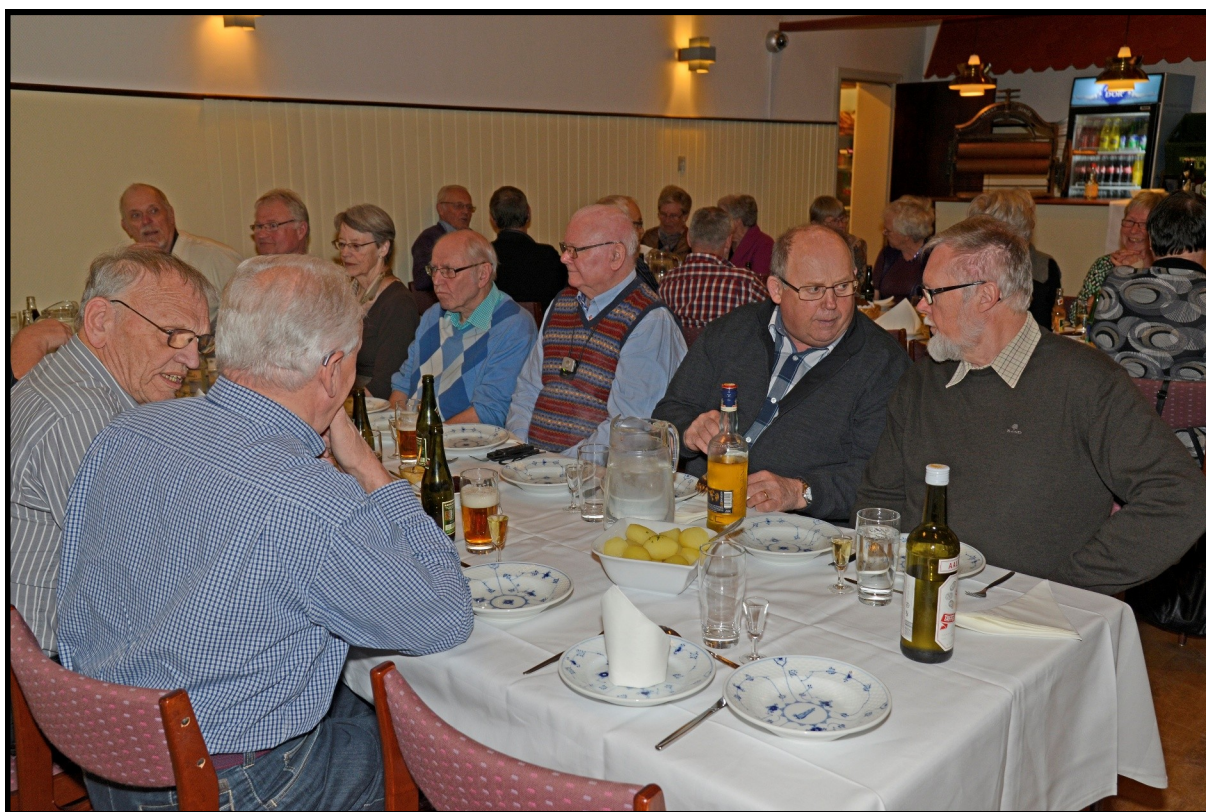
Efter generalforsamlingen var der, som traditionen foreskriver, gule ærter og en lille snaps dertil - hvilket satte gang i en livlig snak blandt arkivfolkene.

Sidste år indeholdt bestyrelsens beretning også nogle knubbede ord om den omlægning af udlånsordningen af arkivalier, som Statens Arkiver gennemførte efter tyverierne af arkivalier fra deres læsesale. Beslutningen var, at vi skulle kontakte kulturminister og Folketingets kulturudvalg om konsekvenserne for den lokalhistori-