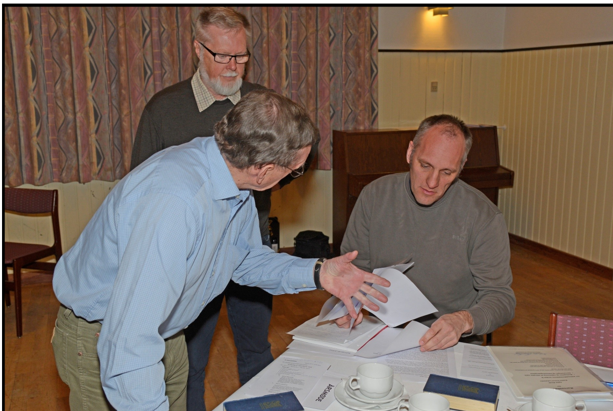
Efter den formelle del af mødet, var der også tid til en snak med arkivkonsulenten.

har for mit vedkommende fyldt meget i det forgangne år. At SVA skulle have en ny hjemmeside var åbenlyst. For det første skulle vi signalere et nyt navn og en ny epoke med skiftet fra RAL til SVA, og for det andet var tiden og den teknologiske udviklingen for længst løbet fra den gamle hjemmeside, som har været i drift siden den 5. november 2003. En hjemmeside med mere end 10 år på bagen er lidt af en »gammel møster«, og derfor landede SLAs hjemmesideløsning også på rette tidspunkt, så jeg efter sommerferien kunne gå i gang med at lave den ny hjemmeside for SVA. De erfaringer jeg herigennem har fået, har jeg efterfølgende kunne vi-