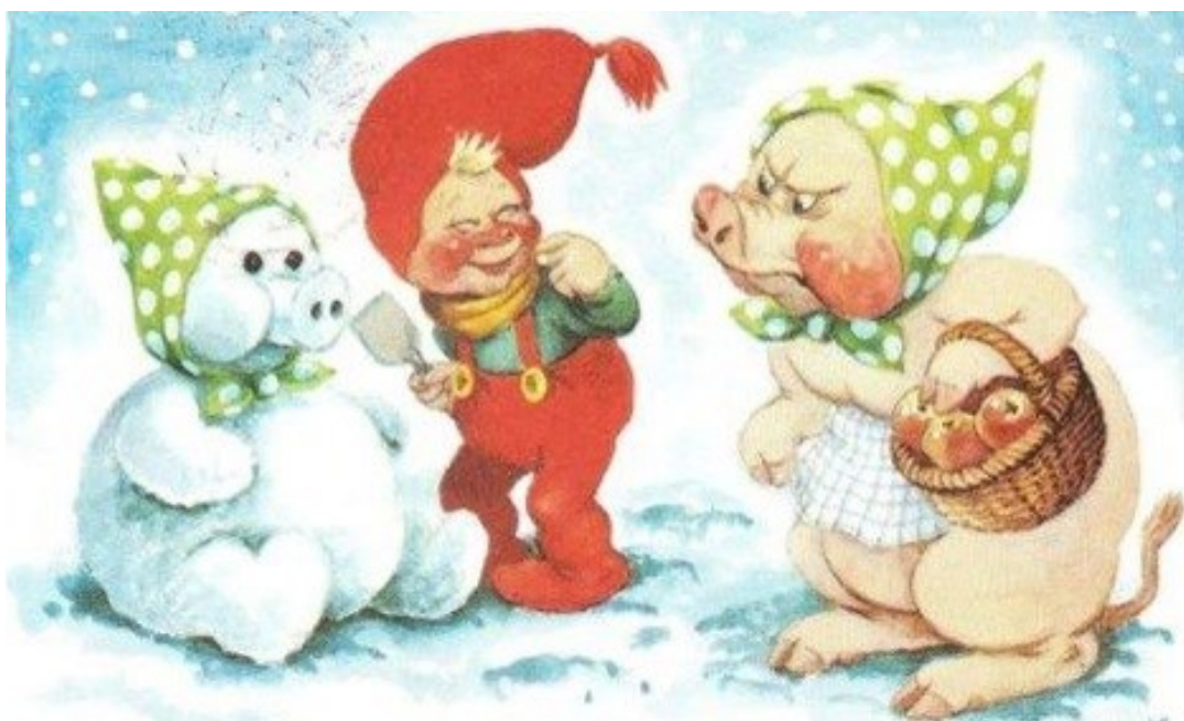
Julekort fra 1960erne.

ligt. Efter slagtingen pakkede mor altid en kurv med forskelligt fra grisen for at give det til nogle af de ældre i vores nabolag. Det var dejligt at få lov at komme med mor sådan en mørk aften, og hvor blev de gamle glade for at få lidt frisk sul.