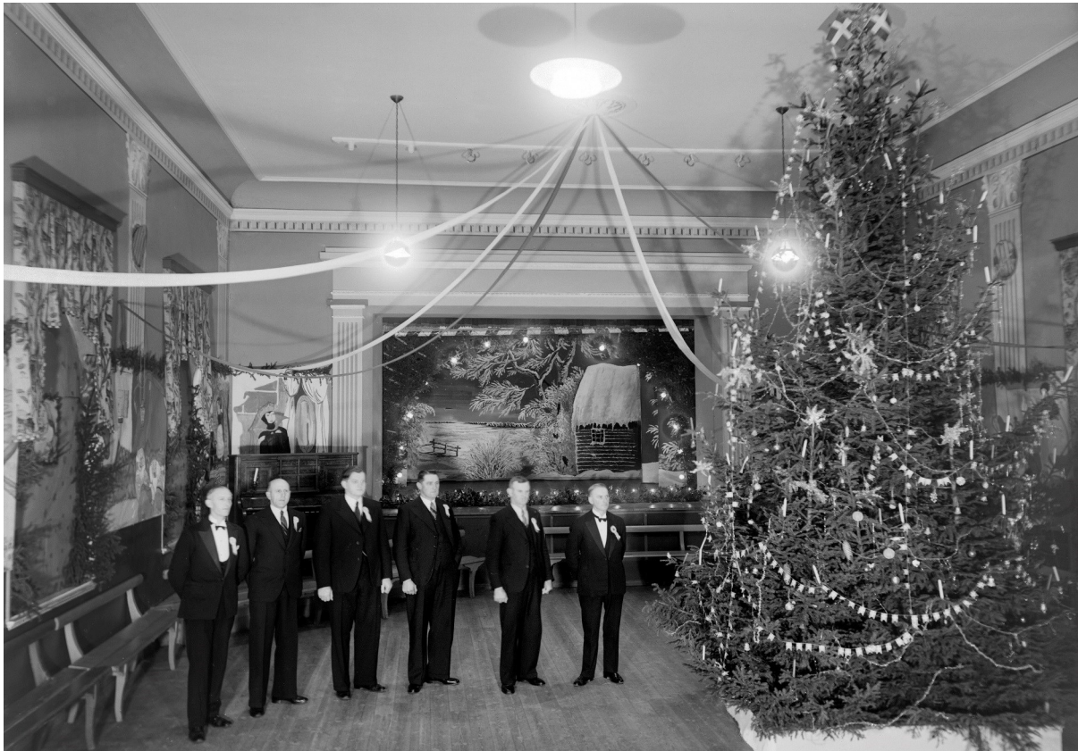
Juletræ i Fanø Håndværker- og Industriforening - kaldet "Strien"