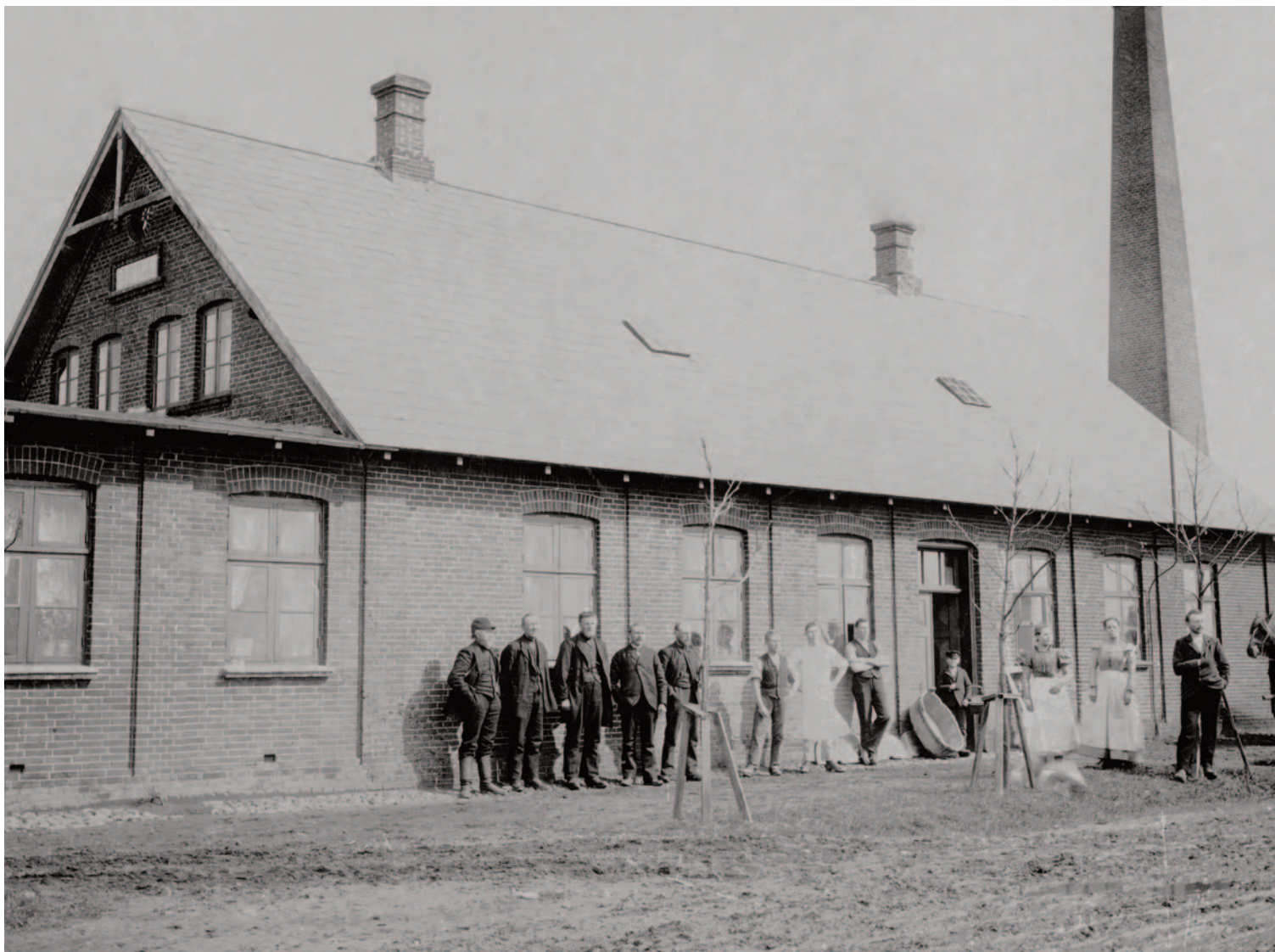
Foto af ukendt mejeri.