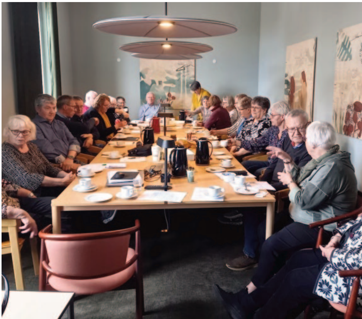
Der var stor interesse for den første arkivcafé. Det lover godt for fremtiden.

En nyhed i SVAs arrangementsprogram for foråret var "Arkivcaféen", hvor man kan mødes under hyggelige former for at lære mere om de kildegrupper, som arkiverne benytter sig af, og i fællesskab blive klogere på brugen af dem. Den første arkivcafé havde temaet kirkebøger og blev afholdt den 3. maj 2023. Interessen var stor, og det er hensigten, at arkivcaféerne fortsætter i efteråret.