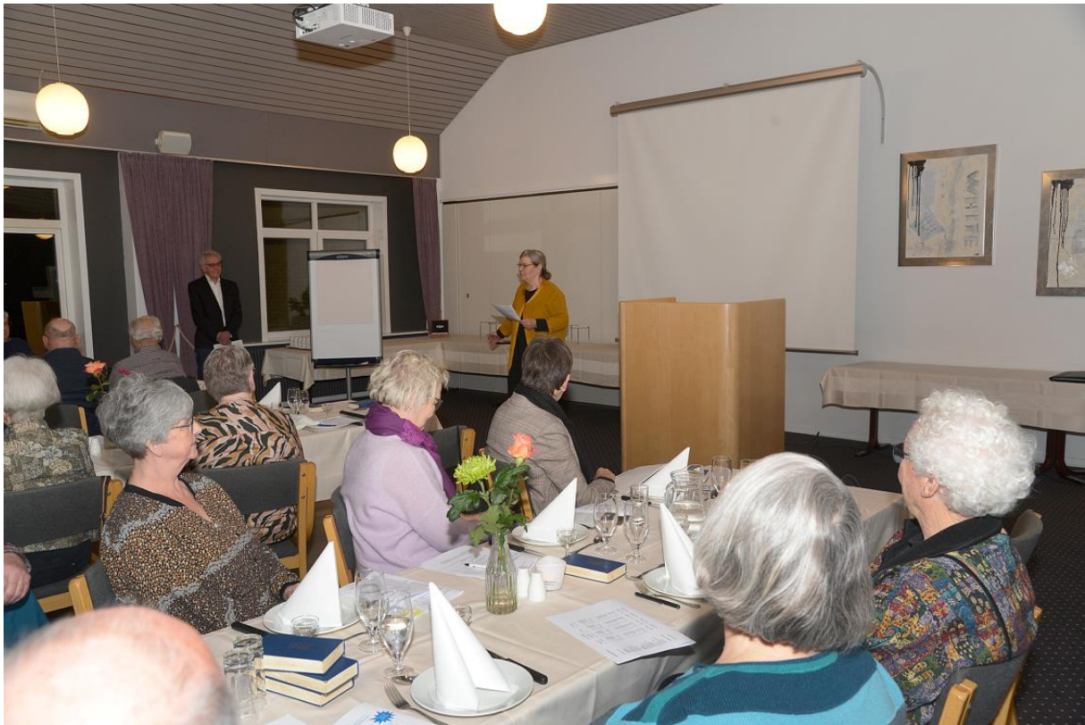
Arkivkonsulenten aflægger beretning til SVAs årsmøde 2023 på Hotel Skibelund Krat.