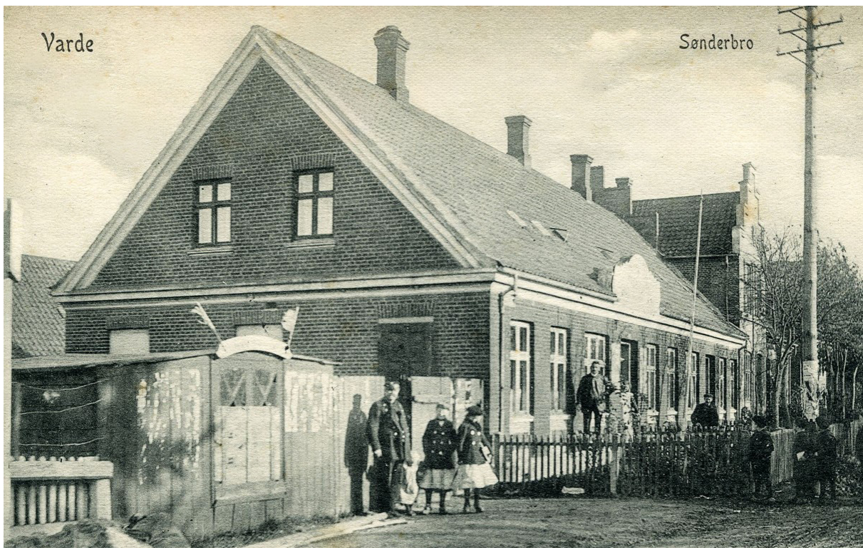
Værtshuset Skandinavien ca. 1910.

der ofte oplysninger om børnearbejde, her skal man også ind i lovgivningen om dette område. Man skal her være opmærksom på, at den kriminelle lavalder for drenge var 10 år og for piger 12 år indtil 1933, hvor de blev ændret til de nuværende 15 år. Hvis en snedkervend kom i forhør, fordi han havde været i værtshusslagsmål, så er der oplysninger om, hvor meget han tjente. Det er der også i de officielle statistikker, men her har vi så de lokale lønninger. Og endelig er der jo selve kriminaliteten. Hvad var årsagerne? Svaret er ret enkelt, fattigdom og alkohol. Og netop alkohol gav anledning til mange debatter i byrådet om antallet af værtshusbevillinger. Når vi er ved alkohol, så kunne man jo også spørge, om det er billigere i dag end i gamle dage at gå på værtshus? Hvis man læser i aviserne, så skriver journalister jo meget om, hvor billigt spiritus var i gamle dage.