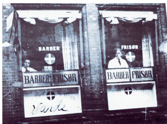
Graversens barbersalon ca. 1916. Korsene i vinduet betyder, at her sælges kondomer.

Kulturlivet. Kirken og fritiden. For kirkens vedkommende så er der de kirkelige arkiver. Præste-, provste- og bispearkiver og fra 1903 menighedsrådets forhandlingsprotokoller. Hvad folk lavede i deres fritid, kan man finde i avisernes annoncer om foreningsaktiviteter og selvfølgelig også i kriminalarkiverne om ballade ved dette eller hint arrangement.